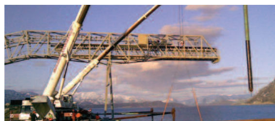
Bygging av nytt kaianlegg.