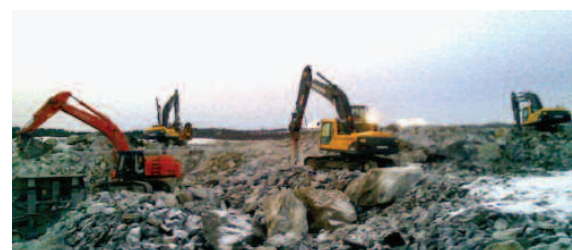
Bryting av stein.